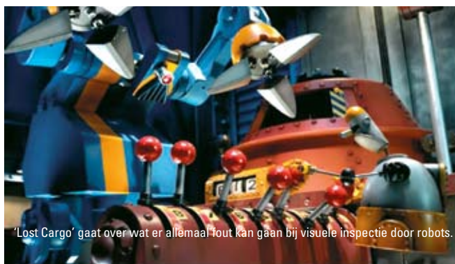
'Lost Cargo' gaat over wat er allemaal fout kan gaan bij visuele inspectie door robots.

Het ruimteschip is eigenlijk een door de ruimte transporterende fabriek, heel revolutionair maar toch realistisch. De spacetrucker van het ruim-